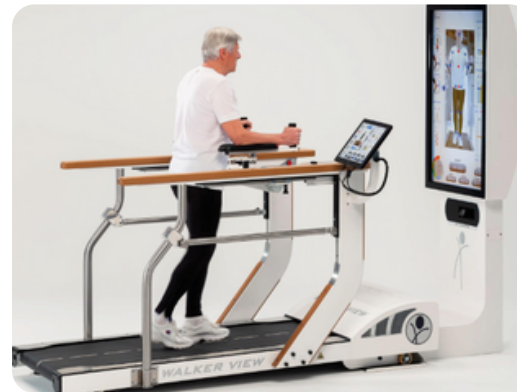
Реабілітаційне відділення лікарні №4 (Дніпро)