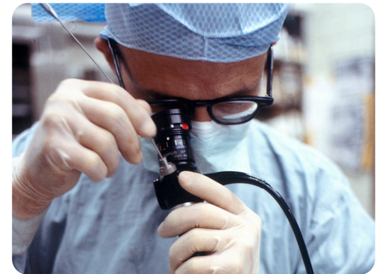
Перша лікарня Києва