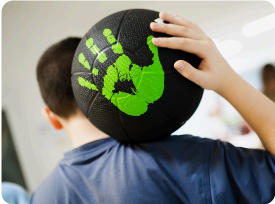
Unbroken Kids при лікарні Св. Миколая (Львів)