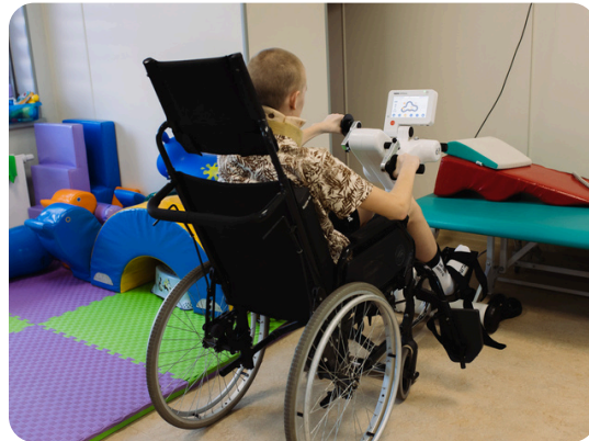
Відділення гострої дитячої реабілітації в Охматдиті (Київ)